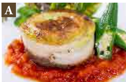
A 大分産太刀魚ロールトマトソース