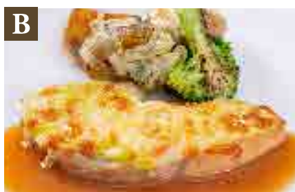
B 大麦仕上三元豚の グリーンマスタードチーズ焼き