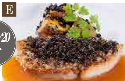
E 大麦仕上三元豚の椎茸デュクセル 【株式会社麻生150周年記念メニュー】