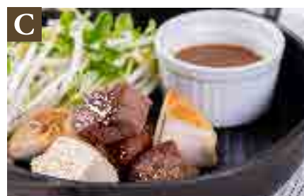
C 牛肉と鶏のサイコロステーキ ジャポネソース or デミグラスソース